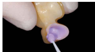
イボクリーンを塗布し、20秒間待つ。