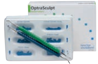
オプトラスカルプトアソートメント