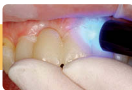
口腔内に装着し、多方向から2～4秒光照射。