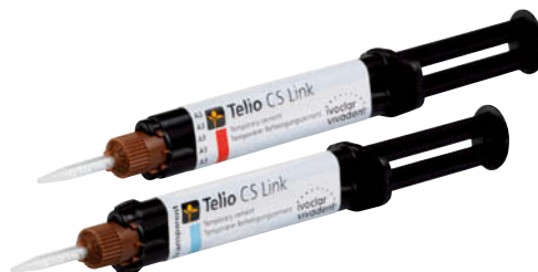
テリオ CS リンク 各6g×2

審美性を重視したデュアルキュア型仮着用レジンセメントです。ユージノールフリーなので、最終補綴物の接着で使用している接着性レジンにも影響を及ぼしません。長期間装着する修復物の仮着にも対応できます。