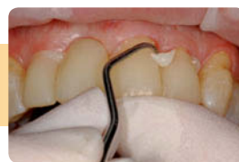
余剰セメントの除去。