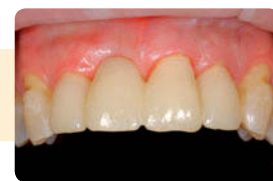
再度、多方向から10秒光照射。化学重合の硬化時間：2.5～3分