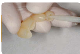
オートミックスで修復物に直接塗布。