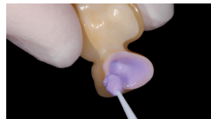
イボクリーンを塗布し、20秒間待つ。