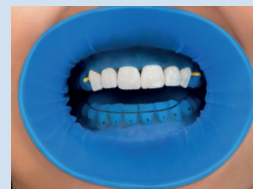
クランプなしで前歯の装着