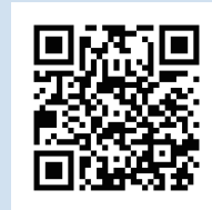
オプトラダム リーフレット