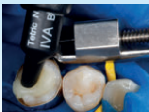
窩洞(深さ約4mm)にIVAを充填し重合