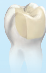
テトリックN-セラム BF