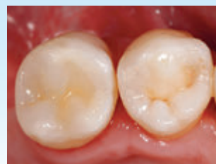
研磨後完成