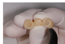
60 秒反応、エアードライ